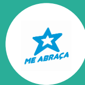
Bloco Me Abraça (Durval)