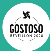
Réveillon do Gostoso