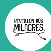
Réveillon dos Milagres