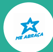
Bloco Me Abraça (Durval)