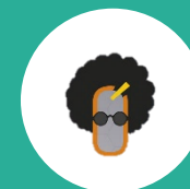
Festa do Oscar